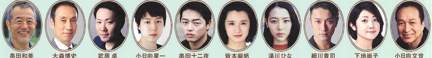
串田和美 大森博史 武居卓 小日向星一 串田十二夜 皆本麻帆 湯川ひな 細川貴司 下地尚子 小日向文世