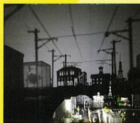
札幌ルーブライン