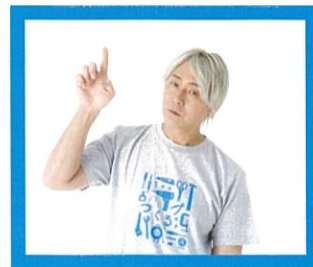
つくる展 北九州会場 アンバサダー：ヒロシ