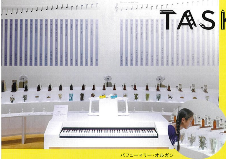
パフェマリー・オルガン