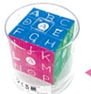
◀プリント キューブ