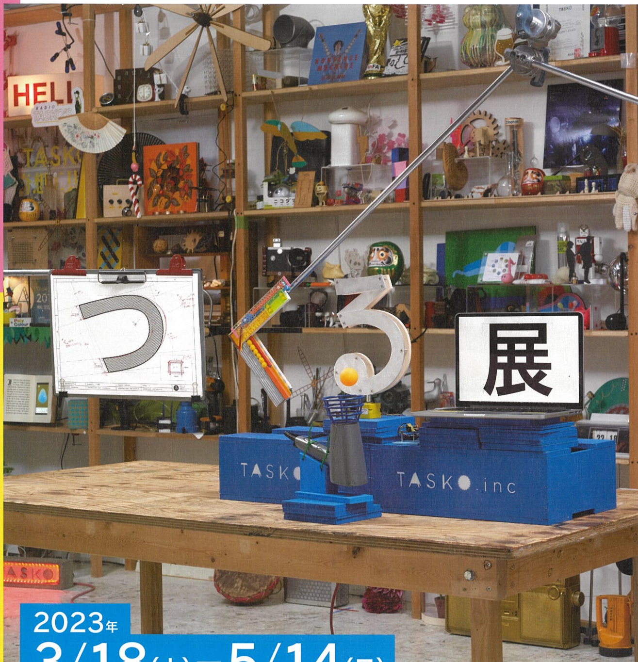
Untitled (Making #235), 2021 © Gottingham Image courtesy of TASKO and Studio Xxingham