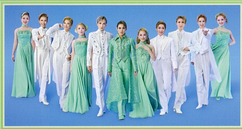
撮影:永石勝 「第一回 春のおどり」タイトル資料提供:松竹大谷図書館

<第一部> 音楽:松岳一輝、坂部剛 振付:伊達谷門取、麻咲梨乃、中山陽子 <第二部> 音楽:玉麻尚一、岩崎廉、湖東ひとみ 振付:大村俊介[SHUN]、森優貴、SARO、澤村萌音 歌唱指導:りく 美術:角田知穂 照明:石原直盛 ムービング:後藤亜由 音響:湯浅典幸 衣裳:森津妙子 舞台監督:木下三郎、田村郡、久住幸子 制作:松竹株式会社、OSK日本歌劇団 製作:松竹株式会社